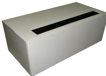
Receptacle // Prise